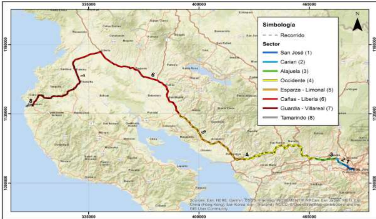
San José – Belén – Tamarindo por Carretera Interamericana Sentido 1-2