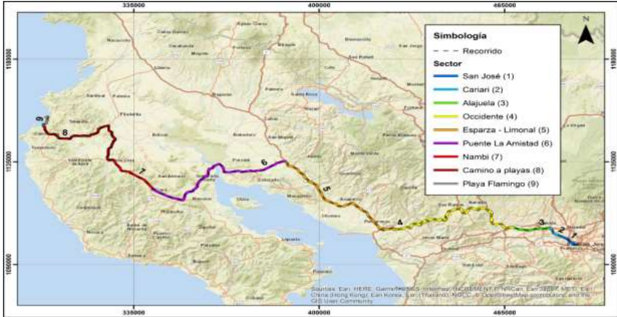
San José – Playa Flamingo por El Puente de La Amistad Sentido 1-2