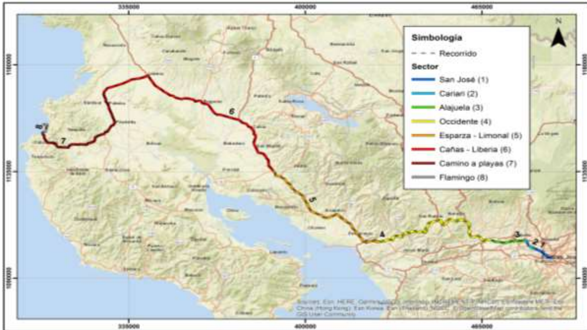
San José – Playa Flamingo por Carretera Interamericana Sentido 1-2

Descripción: San José – Playa Flamingo por Carretera Interamericana