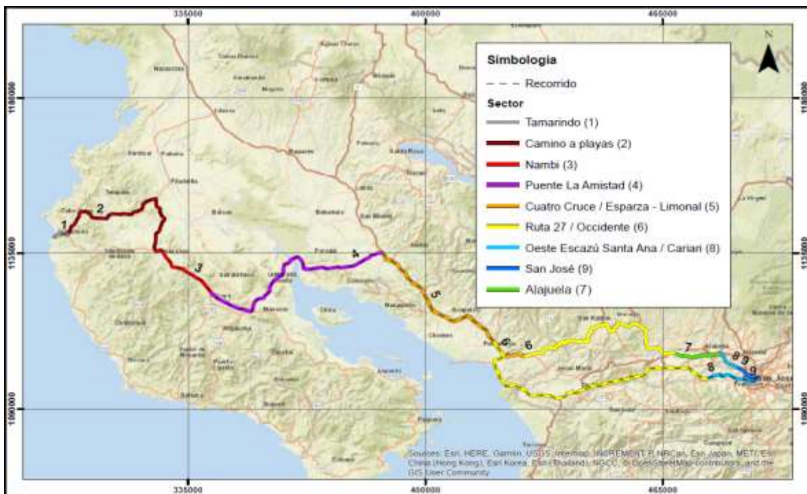
San José – Belén – Tamarindo por el Puente de La Amistad Sentido 2-1