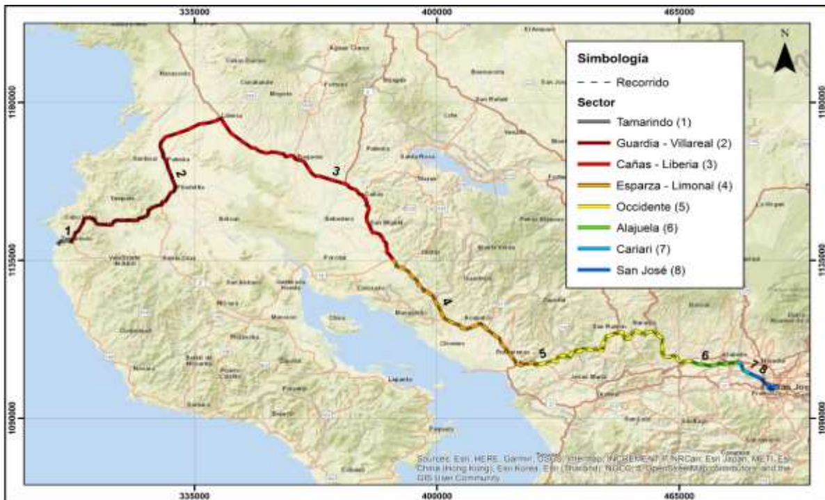
San José – Belén – Tamarindo por Carretera Interamericana Sentido 2-1