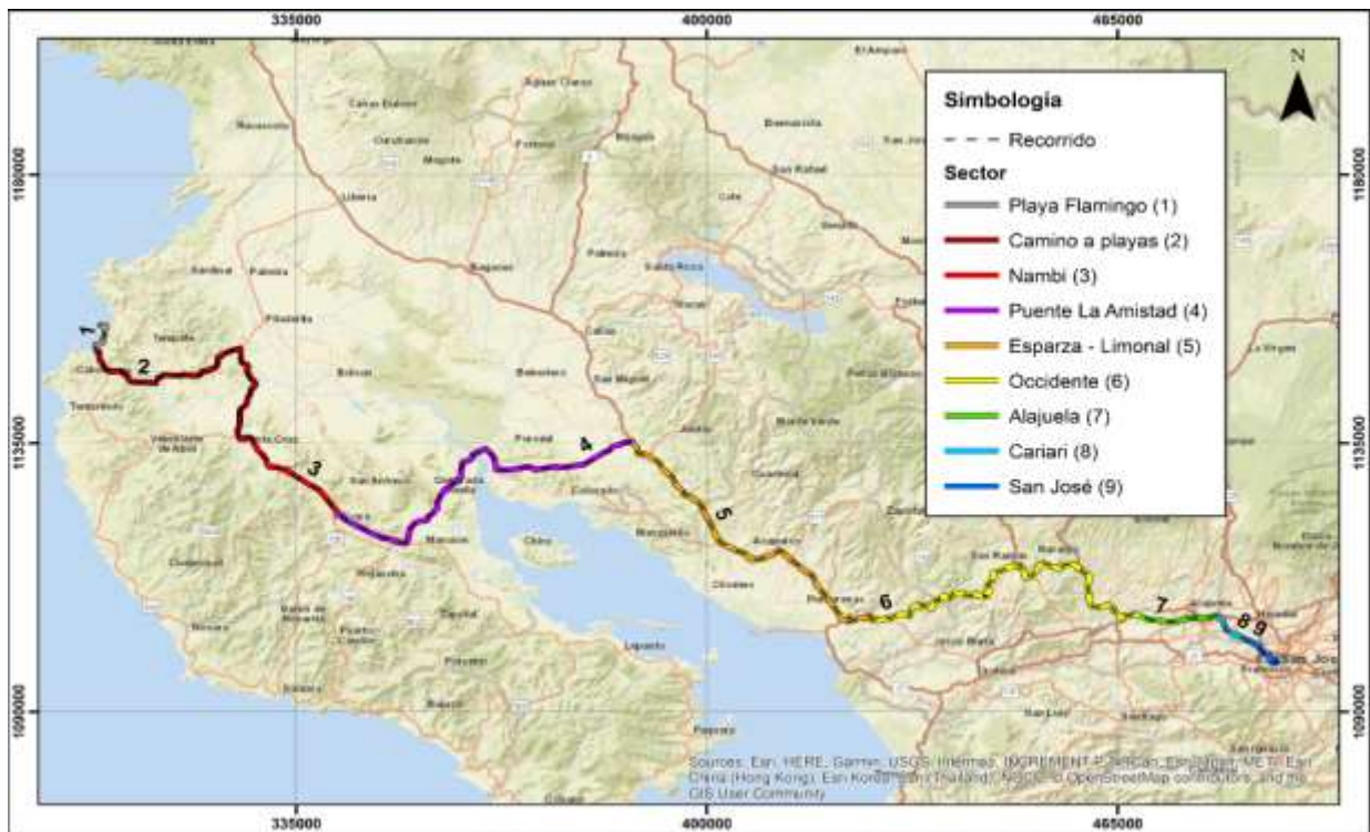
San José – Playa Flamingo por El Puente de La Amistad Sentido 2-1