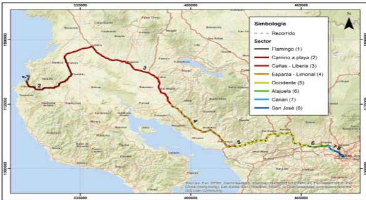
San José – Playa Flamingo por Carretera Interamericana Sentido 2-1

Descripción: San José – Playa Flamingo por El Puente de La Amistad