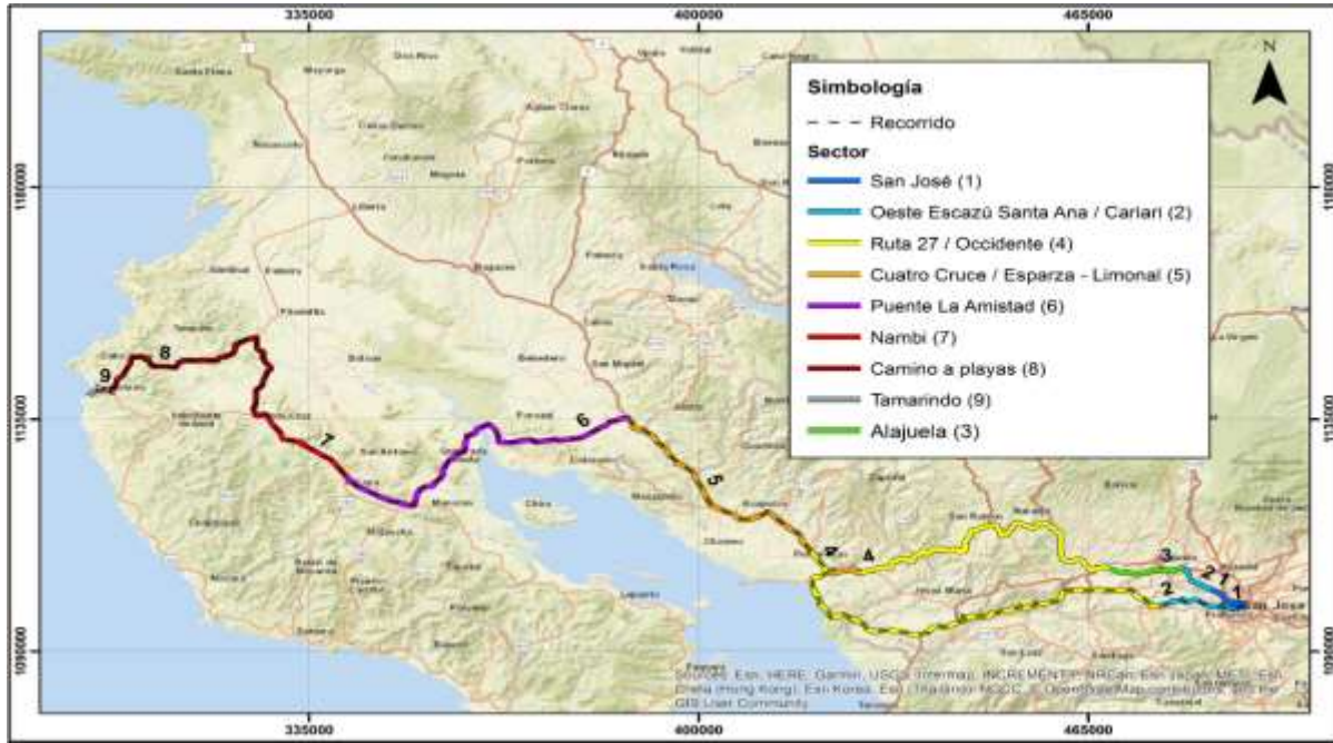
San José – Belén – Tamarindo por el Puente de La Amistad Sentido 1-2