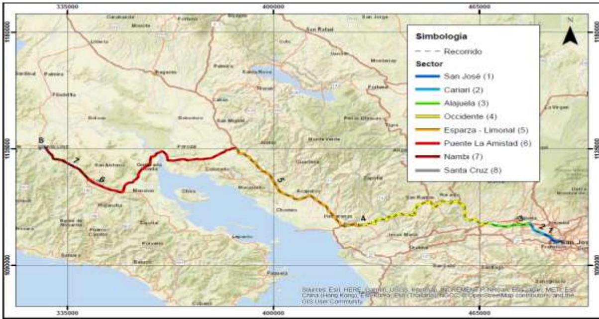
San José – Santa Cruz por el Puente de La Amistad Sentido 1-2